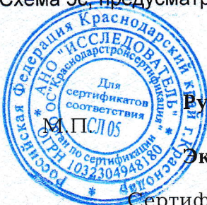
Схема Зс, предусматривающая проведение инспекционного контроля не реже одного раза в год.