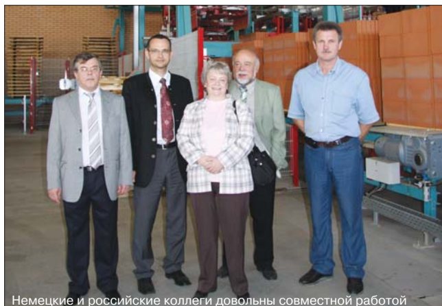
Немецкие и российские коллеги довольны совместной работой

В реализации проекта кроме заказчика и генерального подрядчика участвовали около 20 компаний: ООО «Градоресурс», ООО «Вест-