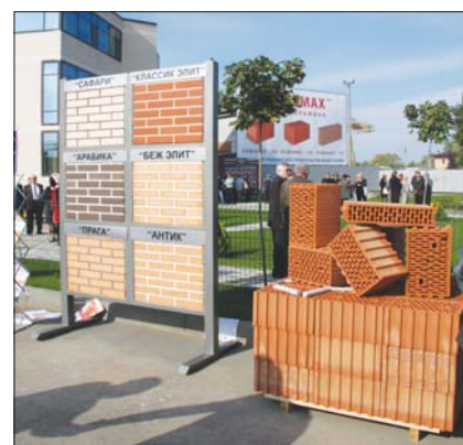
Продукция ОАО «Славянский кирпич»